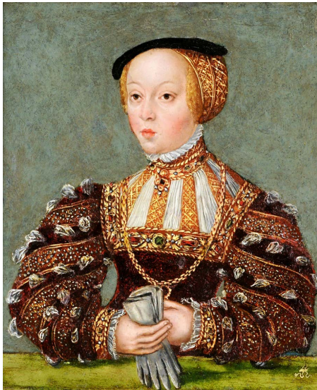
Lucas Cranach, mł., Elżbieta Habsburżanka, Muzeum Książąt Czartoryskich w Krakowie

Celem tego projektu jest rekonstrukcja rozmaitych aspektów wzajemnej wymiany kulturowej, wynikającej z małżeństw polskiego króla Zygmunta Augusta z Habsburżankami, siostrami Elżbietą (1543–1545) i Katarzyną (1553–1572). Podstawowe pytanie dotyczy tego, czy i jakie nowe zjawiska kulturowe pojawiły się na dworze królewskim w Polsce wraz z małżeństwami króla Zygmunta Augusta z arcyksiężniczkami. Zakres i znaczenie tych zmian analizowane są w odniesieniu do ceremonii dworskich, organizacji dworu, religii, muzyki, literatury itd. W których obszarach innowacje te były możliwe, a w których nie, i co o tym decydowało? Przedmiotem badań są również kierunki transferu kulturowego. Czy Habsburżanki przejmowały wzorce, które zastały na dworze jagiellońskim?