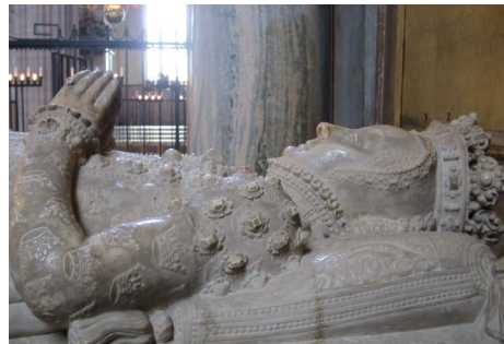
Nagrobek Katarzyny Jagiellonki, Uppsala, katedra

W ramach projektu zrealizowano w 2016 roku w NIH warsztaty „Frictions and Failures. Cultural Encounters in Crisis” oraz towarzyszącą im wystawę „Royal Marriages of Princes and Princesses in Poland-Lithuania, c. 1500–1800” na Zamku Królewskim w Warszawie.