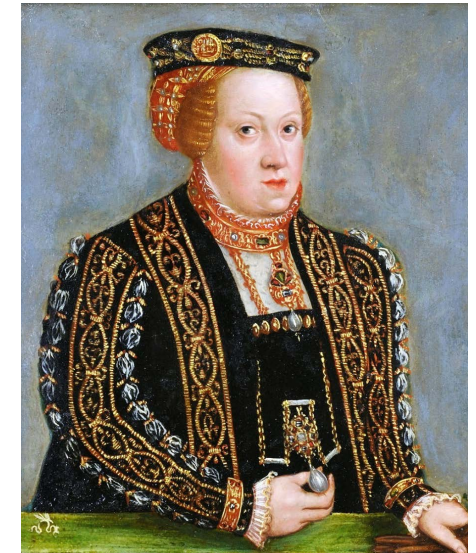
Lucas Cranach, mł., Katarzyna Habsburżanka, Muzeum Książąt Czartoryskich w Krakowie

Punktem wyjścia badań jest charakterystyka otoczenia, w którym wyrastali przyszli małżonkowie, a tym samym określenie „kapitału kulturowego” obu stron. Istotnym zagadnieniem jest również pytanie, w jaki sposób można w połowie XVI w. zdefiniować „kulturę jagiellońską” i „kulturę habsburską”. Nawet jeśli są to nie do końca określone pojęcia, to jednak można w ich perspektywie przedstawić, jak postrzegana i spełniana była rola królowej. Z tym związane jest pytanie o stosunek ustanowionych norm i indywidualnych decyzji w odniesieniu do działań królowej. Porównanie pozycji oraz postawy obu arcyksiężniczek – rodzonych siostr – okazuje się dla badanej problematyki niezwykle owocne, niezależnie od odmiennych okoliczności zawarcia obu tych małżeństw.