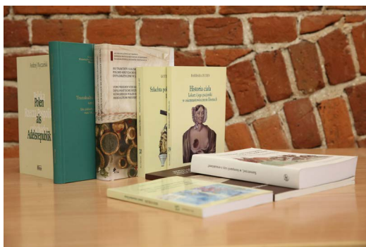
Wydawnictwa Niemieckiego Instytutu Historycznego w Warszawie