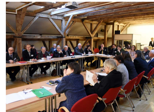
Uczestnicy konferencji „Unia polsko-saska” 2015 r.

HERA Joint Research Programme „Marrying Cultures. Queens Consort and European Identities 1500–1800” miały miejsce wystawa poświęcona małżeństwom dynastycznym na Zamku Królewskim w Warszawie oraz warsztaty „Frictions and Failures – Cultural Encounters in Crisis” (2016).