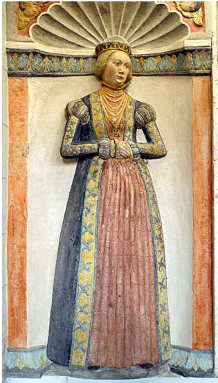
Nagrobek Zofii Jagiellonki, Wolfenbüttel, kościół mariacki