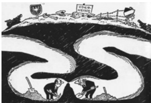
Karikatur zur Ostpolitik (um 1970)

Das Teilprojekt hat eine Untersuchung der an die Polnische Gesellschaft adressierten Inlandpropaganda zum Ziel. Die polnische Propaganda war durch Regelungen der gemeinsamen Politik des Ostblocks gegenüber der BRD beeinflusst, wobei die äußeren Einflüsse allerdings nicht überschätzt werden sollten. Vielmehr stellt sich die Frage, inwieweit Propaganda und Indoktrination miteinander verknüpft waren, welche Rolle die Propaganda im damaligen Machtsystem spielte, in welcher Form Kultur (z. B. Film, Masseliteratur), Rundfunk, Fernsehen und Presse für Propagandazwecke eingesetzt wurden. Das Hauptziel des Projektes gilt der Erforschung der Bilder von den Deutschen und der BRD. Wie entstanden diese Bilder, wie veränderten sie sich und welche Elemente blieben bestehen? Lässt sich das Bild von den Deutschen als Feinbild bezeichnen? Wie waren ältere Stereotype von Deutschen konstruiert und wie wurden sie benutzt? Wie funktionierten die neuen Stereotype?