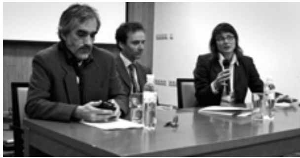
Teilnehmer/innen der Konferenz „Religion im Spiegel des Rechts in Polen-Litauen“

senschaftlerinnen und Wissenschaftler aus Deutschland, Israel, Polen, der Ukraine und den USA, die über jene religiösen Werte und Religionsgesetze diskutierten, die dem polnisch-litauischen Rechtssystem von der frühen Neuzeit bis zum 20. Jahrhundert zugrunde lagen. Dabei galt das Augenmerk insbesondere den Übergängen von der Rzeczpospolita zur imperialen Verwaltung der Territorien durch Russland, Österreich und Preußen bzw. zu den eigenstaatlichen Entwicklungen im Zuge des Ersten Weltkriegs. Bei jedem Wechsel der politischen Herrschaft mussten religiöse Rechte neu ausgehandelt werden und die Gemeinschaften entwickelten unterschiedliche Strategien zu einer Neuverortung der religiösen Koexistenz.