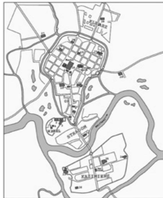
Das mit Magdeburger Recht bewidmete Krakau (Mitte des 14. Jh.)

Am 11. Juni lud das DHI Warschau gemeinsam mit dem Kulturhistorischen Museum in Magdeburg zu einem Workshop über „Das Magdeburger Recht in seinen Auswirkungen auf Politik, Wirtschaft und Gesellschaft im östlichen Mitteleuropa. Überlegungen zu einem europäischen Ausstellungsprojekt“. Der Workshop diente einem interdisziplinär-internationalen Austausch über Möglichkeiten und Perspektiven einer internationalen Ausstellung zum Magdeburger Recht und seiner Rolle in der Geschichte Mittel- und Osteuropas.