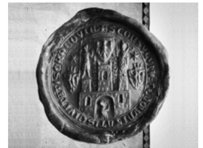
Siegel der Stadt Krakau (14. - 15. Jahrhundert)

piastische Territorialherrschaft gestärkt bzw. intensiviert wurde, zum Gegenstand eines Sammelbandes gemacht worden. Für den Band, der einen repräsentativen Überblick über neueste Erträge der polnischen Forschung zu diesem komplexen Vorgang bietet, wurden insgesamt 16 einschlägige Beiträge polnischer Historiker, Archäologen, Kunst- und Architekturhistoriker ausgewählt, von externen Mediävisten ins Deutsche übersetzt und vom Projektbearbeiter einer eingehenden wissenschaftlichen Redaktion und – im Benehmen mit den Autoren – teilweisen Überarbeitung und Aktualisierung unterzogen. Die Drucklegung des mit einer ausführlichen Einleitung des Projektbearbeiters, zahlreichen Abbildungen und einem umfangreichen Index der Orts- und Personennamen ausgestatteten Sammelbandes konnte im Berichtszeitraum abgeschlossen werden. Der Band erscheint in Kooperation mit dem Institut für vergleichende Städtegeschichte in Münster unter dem Titel „Rechtsstadtgründungen im mittelalterlichen Polen“ im Frühjahr 2011 im Böhlau-Verlag.