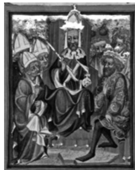
Kaiser Karl IV. im Kreis der Kurfürsten