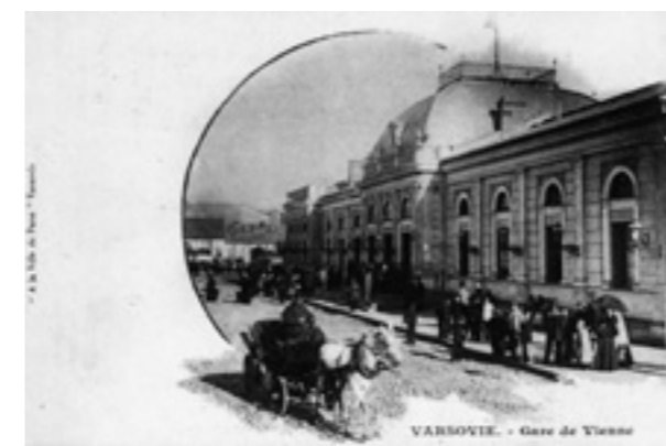
Wiener Bahnhof, Warschau

Ziel des Teilprojektes ist es, europäische Verortungen von Warschauern in kultureller und wissenschaftlicher Hinsicht für das 19. Jahrhundert zu dokumentieren, Kultur- und Wissenschaftstransfers nachzuzeichnen sowie deren Einflüsse auf die diversen Diskurse in der Gesellschaft und auf Innovationen aufzuzeigen. Dabei werden Schnittstellen zwischen polnischen und jüdischen Milieus und deren Aspirationen eine wesentliche Rolle spielen. Ausgangspunkt ist die Grundannahme, dass sich durch die Prozesse von europäischen Verortungen und Vernetzungen sowie durch den Transfer von Kultur und Wissenschaft dichte Verflechtungen im kontinentalen Raum entwickelt haben, die u. a. auch zahlreiche Wechselwirkungen mit den nationalen Identitäten der Warschauer hervorriefen. Als Akteursgruppe der kulturell-wissenschaftlichen Landschaft werden die Warschauer Bürger der Jahrgänge 1770–1870 in den Fokus der Untersuchung gestellt, die im Ausland studierten und deren mitgebrachte Erfahrungen und Kontakte später in das Warschauer Berufsleben einfließen.