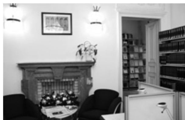
Lesesaal der Bibliothek

delt sich um 1.651 Monographien und 260 Zeitschriftenbände). Damit erhöhte sich die Zahl der insgesamt vorhandenen Bände auf 73.200 bibliographische Einheiten, bei 322 laufend gehaltenen Zeitschriftentiteln.