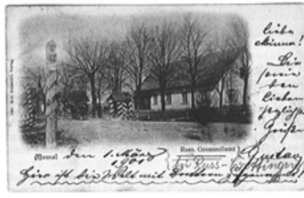
Russisches Grenzzollamt Bajohren um 1900

und Eydtkuhnen sowie Lebenswege von Kaufleuten, Holzhändlern, Schmugglern und Hausierern. Die Auswirkungen des Krimkriegs, des Eisenbahnbaus und des Ersten Weltkrieges werden nachgezeichnet wie auch die Auswirkungen des Nationalsozialismus und der Sowjetisierung Litauens. Einen Schlusspunkt bilden die Analyse der Massenmorde des Sommers 1941, die als „Schlüsselphase in der Geschichte des Holocaust“ zu sehen sind, und die Darstellung der bisher unbekannt jüdischen Arbeitslager in Heydekrug.