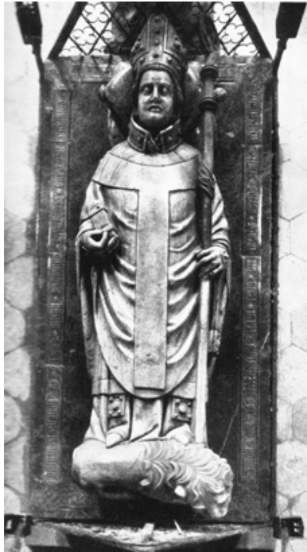
Grabmal des Bischofs Prezlaus von Pogarell (gest. 1376) im Breslauer Dom

titut für Archäologie und Ethnologie der Polnischen Akademie der Wissenschaften eine internationale Konferenz mit dem Titel „Samotrzcę, w kompanii czy z orszakiem? Podróżowanie w średniowieczu i czasach nowożytnych“ [Reisen im Mittelalter und in der Frühen Neuzeit] konzipiert und durchgeführt (s. S. 48).