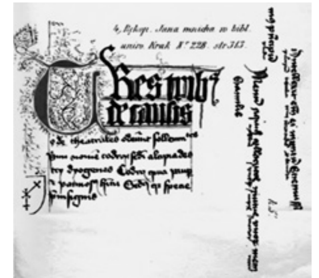
Incipit der Chronica Polonorum des Magister Vincentius

Kolloquium des DFG-Schwerpunktprogramms 1173 „Integration und Desintegration der Kulturen im europäischen Mittelalter“ an der Universität Heidelberg („Herrschaft und dessen Ausformung im Reich und Polen im Spiegel der Chronistik des 12. Jahrhunderts“), auf einer Konferenz in Breslau („Strategien die herrschaftlichen Strukturen in Polen und im Reich im 12. Jahrhundert zu stabilisieren - aus historiographischer Sicht“) sowie in einem Vortrag an der Universität Lublin („Darstellung von Herrschaft des 12. Jahrhunderts im Vergleich: Vincentius Kadlubek über Kasimierz II. Sprawiedliwy und Otto von Freising über Friedrich I. Barbarossa.“) zur Diskussion gestellt.