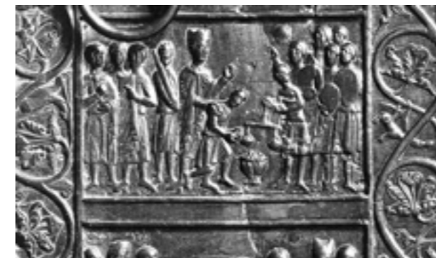
Bolesław der Tapfere auf den Bronzetüren des Doms zu Gnesen (ca. 1170-1180)

Ausgehend von einem methodischen Ansatz, der sich gleichermaßen für die anthropologischen, kultur- und diskursgeschichtlichen wie die politischen, wirtschaftlichen und sozialen Dimensionen mittelalterlicher Herrschaft interessiert, hat der Forschungsbereich die dynastische Herrschaft der Piasten in das Zentrum seines Erkenntnisinteresses gestellt. Wie wurde diese Herrschaft begründet, durchgesetzt und auf Dauer gestellt? Welche Mechanismen, Instrumente und Ver- fahren der Herrschaftsausübung, der Verständigung zwischen Fürsten und Gefolgsleuten bzw. Amtsträgern kamen zur Anwendung? Wie erfolgten die Inter- essenausgleiche und Konsensbildungen zwischen dem Herrscher und den Großen? Wie wurde die Kommuni- kation und Interaktion zwischen Herrscher und poli- tischen Eliten bzw. zwischen dem Herrschaftsapparat und der Gesellschaft bzw. den Untertanen gestaltet? Wie wurden in diesem Beziehungsgeflecht die wirt- schaftlichen und militärischen Grundlagen königlicher bzw. herzoglicher Macht und Herrschaftsausübung begründet, aufrechterhalten und ausgeweitet, wie ihre Außenbeziehungen gestaltet?