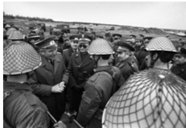
Armeegeneral der NVA Heinz Hoffmann (l.), Armeegeneral der Polnischen Armee Wojciech Jaruzelski (M.) und Marschall der Sowjetunion Viktor Kulikow (r.) nach Abschluss der Warschauer-Pakt-Übung „Drushba“ 82

in Polen seitens der NVA-Führung im Mittelpunkt. Parallel zur Literaturrecherche wurde in Warschauer Archiven (Institut des Nationalen Gedenkens, Archiv der Neuen Akten) sowie im Bundesarchiv (Berlin-Lichterfelde, Militärarchiv Freiburg) mit der Erschließung der relevanten Aktenbestände begonnen. Es wurden Akten aus der Zeit des Kriegsrechts 1981-83, des Warschauer Pakts, des Zentralkomitees der Polnischen Vereinigten Arbeiterpartei (PVAP), des Zentralkomitees der SED, des Ministeriums für Nationale Verteidigung der DDR, des Hauptstabs der NVA sowie der Politischen Hauptverwaltungen der NVA und der Grenztruppen der DDR eingesehen.