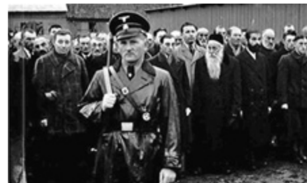
Raciąż, ca. September/Oktober 1939: „Judenaktion“ in Raciąż

eine internationale Konferenz zurück, die das Deutsche Historische Institut Warschau gemeinsam mit dem Institut des Nationalen Gedenkens im September 2005 in Kattowitz zum Thema „Die Judenvernichtung in den in das dritte Reich eingegliederten polnischen Gebieten während des Zweiten Weltkriegs“ durchgeführt hat. Im Mittelpunkt der Analyse stehen die Reichsgaue „Danzig-Westpreussen“ und „Wartheland“, die Region Ost-Oberschlesien sowie die Regierungsbezirke Zichenau und Białystok, die bisher nur sehr selten im Zentrum der Holocaustforschung standen. Dabei wird die Rolle dieser ‚eingegliederten Gebiete‘ im Prozess der endgültigen Entscheidungen über die Ermordung der jüdischen Bevölkerung untersucht, darunter Aspekte wie das Verhältnis von Zentrum und Peripherie oder die Handlungsmotive lokaler NS-Täter. Zudem werden die einzelnen Stufen der Verfolgung der Juden von ihrer Entrechtung und Ghettoisierung bis hin zur systematischen Ermordung eingehend analysiert. Ein separater Teil widmet sich dem Funktionieren der Arbeits-, Vernichtungs-, und Konzentrationslager, darunter der bisher wenig bekannten finanztechnischen Verwaltung des Todeslagers Kulmhof, die auf eine zentrale Rolle der Gauverwaltung im Tötungsprozess hindeutet. Daneben schildert der Band die Reaktionen auf den anlaufenden Holocaust innerhalb der bedrohten jüdischen Bevölkerung seitens der ethnisch polnischen Bevölkerung und der Alliierten.