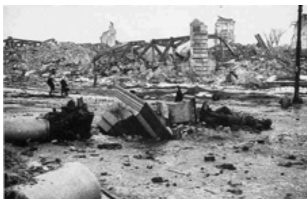
zerstörtes Warschau 1944

einheimischer Sicht ebenso umfasst wie Experten- und Zeitzeugeninterviews, haben die einzelnen Teilprojekte das Zeitalter der Extreme im Berichtszeitraum aus verschiedenen Perspektiven untersucht. Sie haben dafür in komplementärer Weise ebenso auf sozial- und wirtschaftshistorische Ansätze zurückgegriffen, wie auf Überlegungen der Mentalitäts- und Kulturgeschichte sowie auf aktuelle methodische Konzepte beispielsweise zu Tätern, Opfern und Geschlechterverhältnissen.