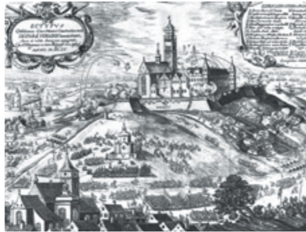
Schwedische Belagerung der Jasna Góra in Częstochowa. Georg Förster Danzig 1659