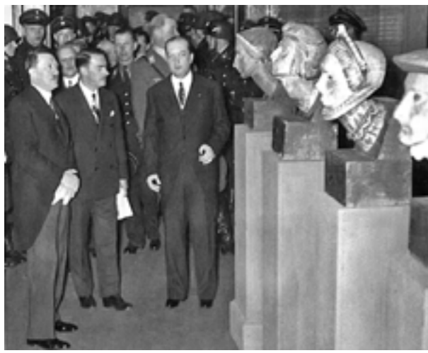
Feierliche Eröffnung der polnischen Kunstausstellung in der Preussischen Akademie der Künste in Berlin am 29. März 1935. Botschafter Józef Lipski (rechts) und Ausstellungskommissar Mieczysław Treter (Mitte) zeigen Hitler Skulpturen von Xawery Dunkowski

auswärtige Kulturpolitik galt es wiederum die Gunst des Augenblicks zu nutzen und sich in Deutschland mit einem interessanten Kulturangebot als eine dem westeuropäischen Kulturkreis angehörende Nation zu präsentieren. Einschlägige Aktivitäten sollten den Polen Respekt bei Nationalsozialisten eintragen und das nach 1919 geprägte Stereotyp von Polen als einem „Saisonstaat“ aus der Welt schaffen.