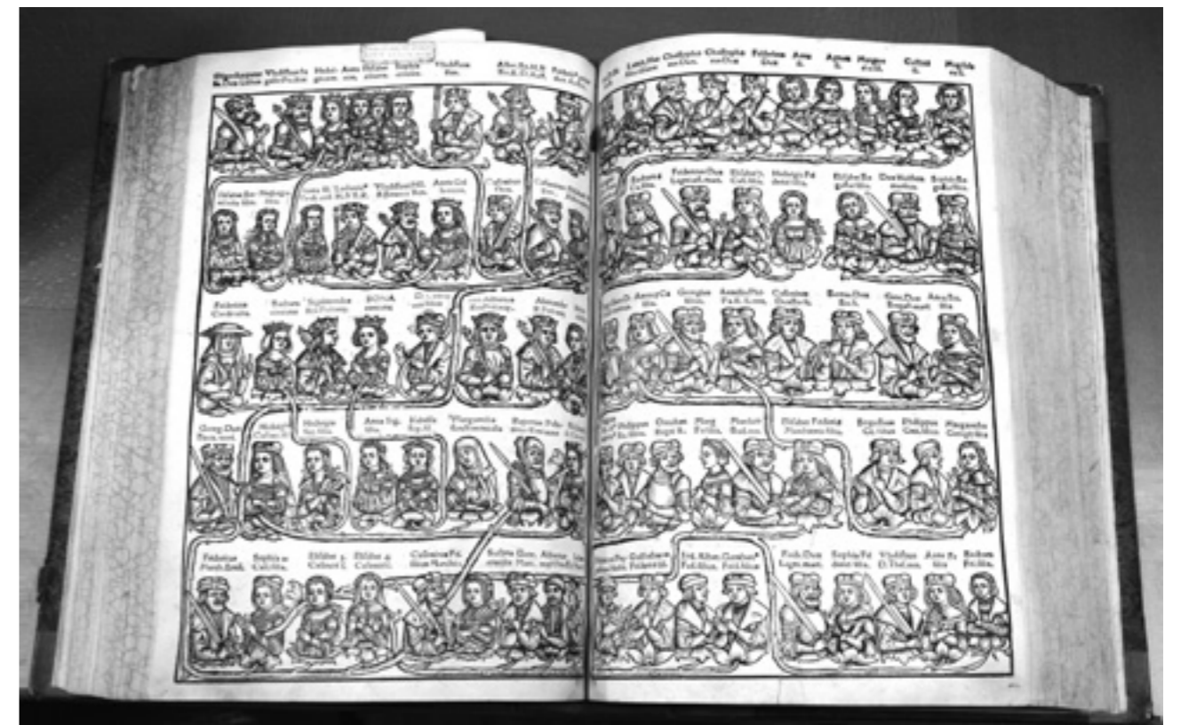
Stammbaum der Jagiellonen

Im Einzelnen wurde die Fragestellung des Teilprojektes im Berichtsjahr in einer interdisziplinären und vergleichenden Betrachtung der Dynastie der Jagiellonen verfolgt, welche die Geschichte der Dynastie in ihrem gesamten, von der Ostsee bis zur Adria und zum Schwarzen Meer reichenden Herrschaftsgebiet ausleuchtet. Das jagiellonische Herrschaftssystem kann als Vorläufer von Unionsbemühungen gesehen werden, in denen bei einem gemeinsamen höheren Ziel die Eigenständigkeit der Länder gewahrt blieb. Auch wenn die Dynastie nur verhältnismäßig kurzen Bestand hatte, lebten ihre Mitglieder doch in einer Zeit des politischen und kulturellen Umbruchs an der