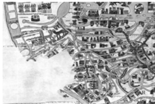
Die Polonia auf der Ebstorfer Weltkarte von ca. 1230-1250

mittelalterliche Germania Slavica , die frühen Akkulturationsvorgänge, die mit den Schlagworten Christianisierung und Europäisierung gefasst werden, der hochmittelalterliche Landesausbau sowie die Deutung landesgeschichtlicher Entwicklungen, etwa in Schlesien oder Preußen als Konkretisierungen deutsch-polnischer Beziehungen. Wirkungsgeschichtlich wichtig sind auch die Ausbildung von Stereotypenbildungen und die Formung mittelalterlicher Vorgänge als Folie neuzeitlicher nationaler Diskurse. Neben der Klärung konzeptioneller Fragen wurden im Berichtszeitraum die Textgliederung vorangebracht und die Quellen- und Forschungsliteratur systematisch erfasst.