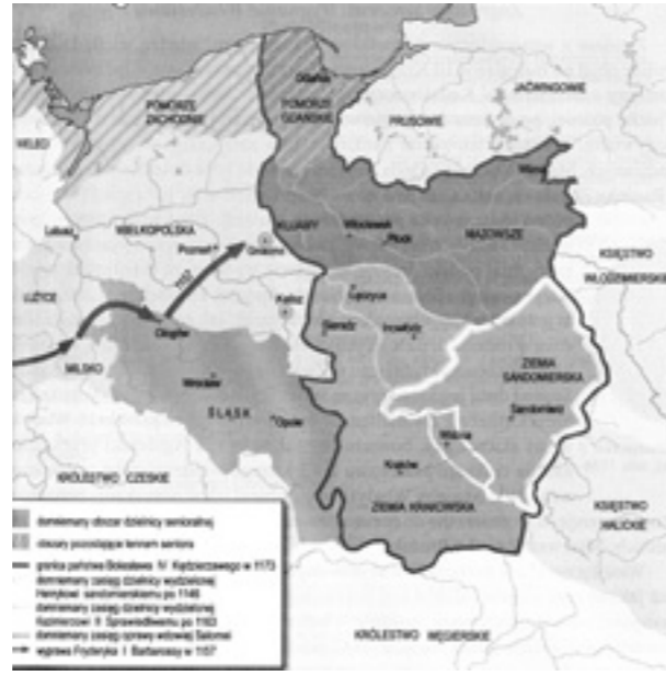
Divisio regni im piastischen Polen nach 1138

Im Berichtszeitraum wurde eine allgemeine Bibliographie zum Forschungsvorhaben erstellt, die ständig erweitert wird. Ferner wurden zwei Textteile in einem ersten Entwurf abgefasst, die zum einen die historiographische Einleitung und Problemstellung, zum anderen die genealogischen Legitimitätsargumentationen in den dynastischen Hauskämpfen erörtern. Zwei weitere Projektteile wurden ferner zum Verfassen vorbereitet. Im Berichtszeitraum erfolgte ein einmonatiger