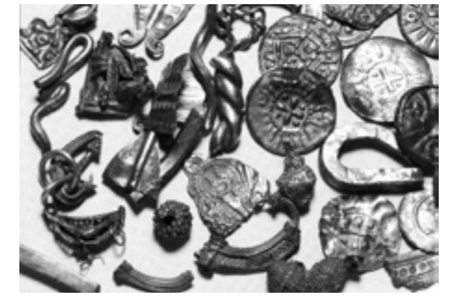
Silberschatzfund aus Kąpiel/Gniezno (deponiert nach 983)

stärkt einsetzende Münzprägung für die Herrschaftsausübung der Piasten einen Wandel bewirkten.