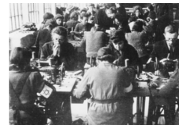
„Szop“ im Warschauer Ghetto 1942 - deutsches Propagandafoto

öffentlichen. Im Dezember konnte gemeinsam mit dem Jüdischen Historischen Institut (ŻIH) eine seit Beginn des Berichtsjahres konzipierte und vorbereitete Konferenz zum Thema „Arbeit in nationalsozialistischen Ghettos“ durchgeführt werden (s. S. 51), zu der ein eigener Vortrag beigesteuert wurde („Verwaltung und SS. Konträre Interessen in der Judenpolitik?“). Weitere Aspekte des Projektes wurden im Kolloquium des Jüdischen Historischen Instituts („Ghetto Labour Pensions: Holocaust Survivors and Their Struggle for Compensation in the 21st Century“), im Rahmen der Jugendbegegnung des Deutschen Bundestags anlässlich des Gedenktages für die Opfer des Nationalsozialismus („Die Deutschen und die alltägliche Gewalt der Besatzung“), anlässlich eines Lehrgangs zur Generalstabsausbildung der Führungsakademie der Bundeswehr („Besatzeralltag im Zweiten Weltkrieg“), auf einer Konferenz der Justizakademie des Landes NRW („Ghettorenten. Erfolg oder Scheitern der letzten Wiedergutmachung?“) und einer Tagung der Hanns-Seidel-Stiftung („Deutsche Besatzungspolitik in Polen 1939-1945“) präsentiert.