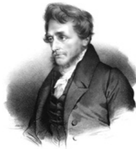
Joachim Lelewel (1786-1861)

Das nach dem „Gründervater“ der polnischen Geschichtswissenschaft, dem Universalhistoriker und Politiker Joachim Lelewel benannte Gesprächsforum dient der Diskussion aktuell umstrittener Fragen der polnischen Geschichte in ihrem europäischen Kontext. Die Lelewel-Gespräche finden einmal im Halbjahr statt und führen jeweils Vertreter aus der polnischen, ost- und westeuropäischen bzw. internationalen Geschichtswissenschaft zu einer kontroversen Debatte zusammen, an der sich auch das Publikum aktiv beteiligt. Anliegen ist es, nicht nur gegensätzliche, sich wechselseitig nicht selten ausschließende Thesen und Ansichten miteinander zu konfrontieren, sondern auch verschiedene geschichtswissenschaftliche Milieus in einen intensiven Austausch zu verwickeln. Damit wird sowohl eine Weiterentwicklung des jeweils erörterten Problems als auch eine Öffnung für unterschiedliche methodische Herangehensweisen gefördert.