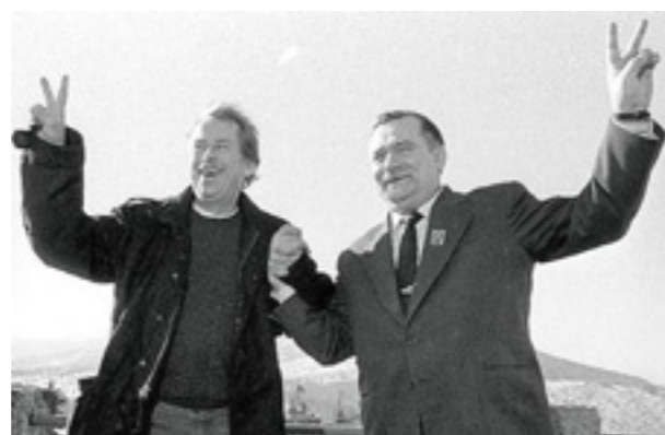
Vaclav Havel und Lech Wałęsa auf der Schneekoppe 1990

Im Berichtszeitraum wurden umfangreiche Archivarbeiten durchgeführt: Im Archiv für soziale Demokratie in Bonn und im Archiv Grünes Gedächtnis in Berlin konnten Materialien zum Polen-Engagement des DGB und der Friedensbewegung recherchiert werden. Im Februar-März sowie im November konnten Bestände verschiedener Archive in Washington, DC, der Ronald Reagan Presidential Library, der Hoover Institution in Stanford sowie der Charles E. Young Research Library in Los Angeles eingesehen werden. Daneben wurden in Warschau Akten des polnischen Innenministeriums und des Sicherheitsdienstes in den Beständen des IPN gesichtet. Parallel zu den Archivrecherchen erfolgte eine intensive Auswertung der bereits gesammelten Materialien. Im unmittelbaren Zusammenhang der Projektarbeiten stand die konzeptionell-inhaltliche Vorbereitung und Durchführung einer Konferenz zum Thema „Opposition transnational: Die Menschenrechts- und Demokratiebewegungen Mittel- und Osteuropas aus transfer- und verflechtungsgeschichtlicher Perspektive“ (s. S. 49) sowie die Gestaltung und Durchführung des dritten Joachim-Lelewel-Gesprächs zum Thema „Geheimdienstakten als Quellen zeit-historischer Forschung. Chancen - Herausforderungen – Probleme“ (s. S. 43). Ergebnisse des Projektes wurden