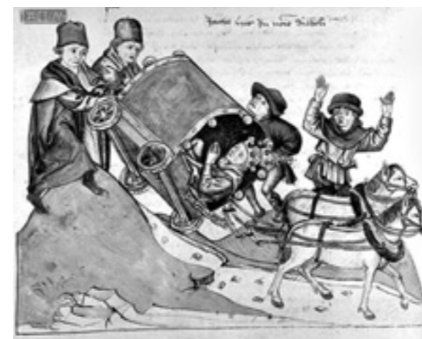
Der Fall des Papstes Johannes 23. Aus der Chronik von Ulrich von Richental

(DHI Warschau) konzipierten Tagung stand die Reisekultur der europäischen Eliten im Mittelalter und in der Neuzeit. Dieses Phänomen wurde in mehreren Beiträgen aus verschiedenen Blickwinkeln analysiert: als eine Komponente des Lebensstils, als Statussymbol sowie als Instrument der Verfestigung eigener sozialer Positionen. Mit der Frage nach dem Statussymbol war auch die Thematik der prachtvollen Einzüge in die Städte verbunden, die ein typisches Beispiel der elitären Ostentation darstellten. Einige Referenten thematisierten das Phänomen der Bildungsreise, die charakteristisch für die oberen Schichten war, sowie das Kultivieren des Bildungsreisrituals innerhalb mancher Familien. Daneben wurde der Grad der Mobilität der kirchlichen und weltlichen Eliten zur Diskussion gestellt. Eine separate Sektion war dem organisationstechnischen sowie dem wirtschaftlichen Aspekt des Reisens gewidmet. So wurde z.B. anhand buchhalterischer Quellen ein Blick in die Reisekosten im Spätmittelalter geworfen oder (am Beispiel des neu entdeckten Reiseinventars König Sigismunds des Alten von 1525) der Frage nach der königlichen Reiseorganisation nachgegangen. Besonderes Interesse weckten Beiträge über europaweite Reisen von Frauen. In diesem Kontext wurde eingehend der Grad der Mobilität von Frauen untersucht. Geographisch stand die Region des östlichen Mitteleuropa mit besonderer Berücksichtigung Polens