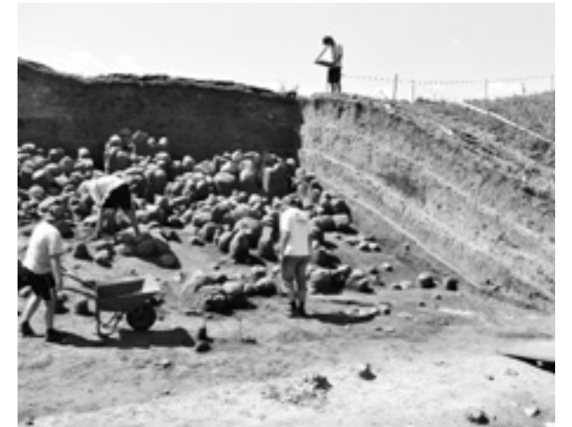
Burgwallgrabung in Tum-Łęczycza, Juni 2010

Im Berichtszeitraum wurden zunächst die materiellen Voraussetzungen (Computerausstattung, GPS-fähiger Satellitenempfänger, GIS-Software) geschaffen und die inhaltlich-konzeptionellen Grundlagen des Vorhabens entwickelt, für dessen mittelfristige Fortführung ein Drittmittelantrag erarbeitet werden soll. Dazu erfolgte der weitere Aufbau notwendiger Kooperationsstrukturen (mit dem Geisteswissenschaftlichen Zentrum Geschichte und Kultur in Leipzig, dem Institut für