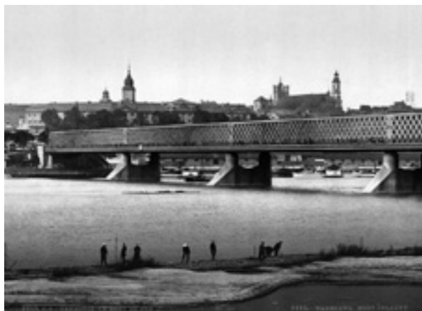
Warschau, Weichselbrücke um ca. 1900

Nachdem der Nationalstaat lange Zeit bevorzugter Gegenstand der Geschichtswissenschaft war, nimmt die historische Forschung im Zuge ihrer Entgrenzung stärker die Bedeutung grenzübergreifender Verflechtungen, Wahrnehmungen und Transfers in den Blick. Dabei zeigt sich, dass die Intensivierung transnationaler Kontakte und Interdependenzen ein Phänomen ist, das nicht erst mit der so genannten „Globalisierung“ einsetzt, sondern dessen Ursprünge bis ins 18. Jahrhundert zurückreichen. Die Entstehung moderner Kommunikations- und Verkehrsmittel, aber auch das Aufkommen von Wissenssystemen oder politischen Ideologien mit universellem Anspruch bewirkten, dass eine bis dahin nicht gekannte Steigerung der Mobilität, eine Verdichtung grenzübergreifender Netzwerke sowie eine Intensivierung interkultureller Wahrnehmungen und Transfers zu einem Charakteristikum des 19. und 20. Jahrhunderts wurden.