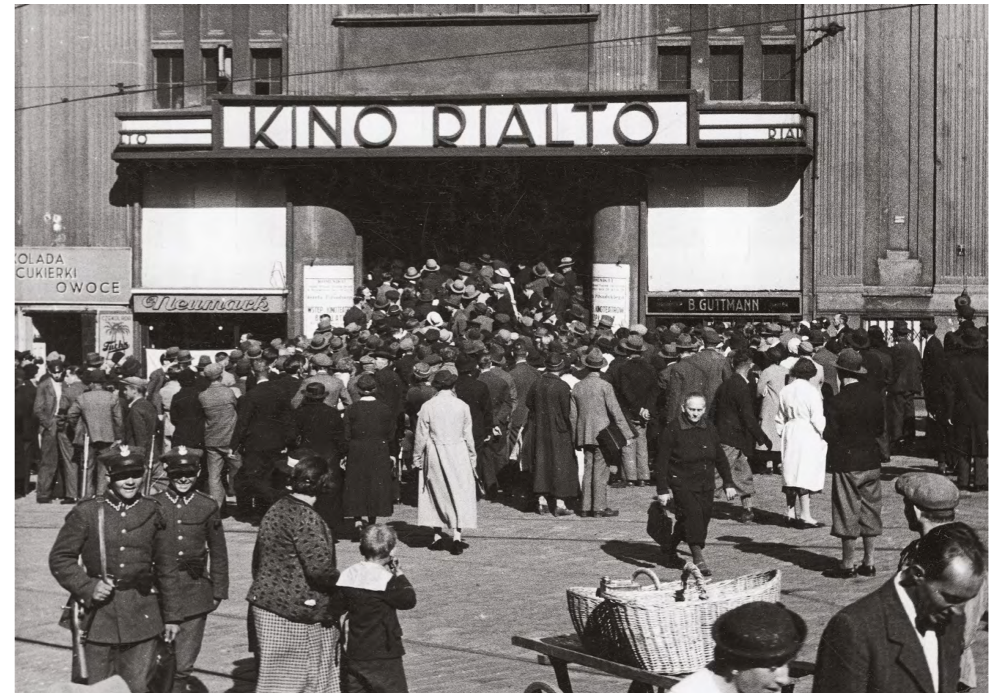
Kino Rialto

über den Verkauf von Kinotickets gab? Welchen Wert haben die Berichte von Besatzungsmächten und der Geheimpolizei für die Erforschung des Filmpublikums? Wie können quantitative und qualitative Methoden miteinander kombiniert werden? Kann eine Wirkung von Filmen und Fernsehsendungen auf die Geschichtskultur nachgewiesen werden?