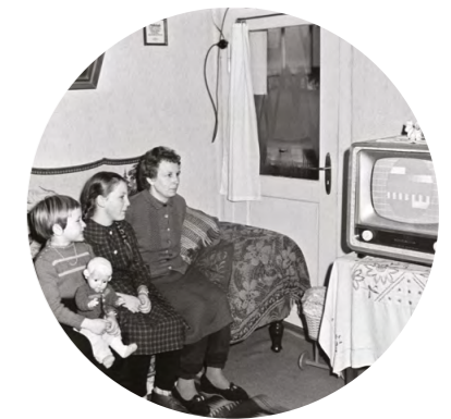
Familie beim Fernsehen („Testbild“), Ferch 1961