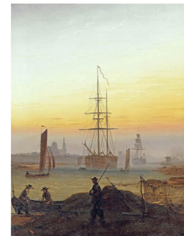
Caspar David Friedrich: Schiffe im Hafen von Greifswald

8. November 2016, 18.00 Uhr, DHI Warschau